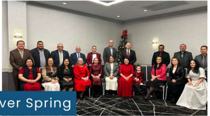
Distrito Silver Spring