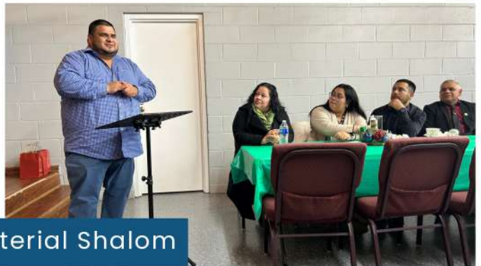
Centro Ministerial Shalom